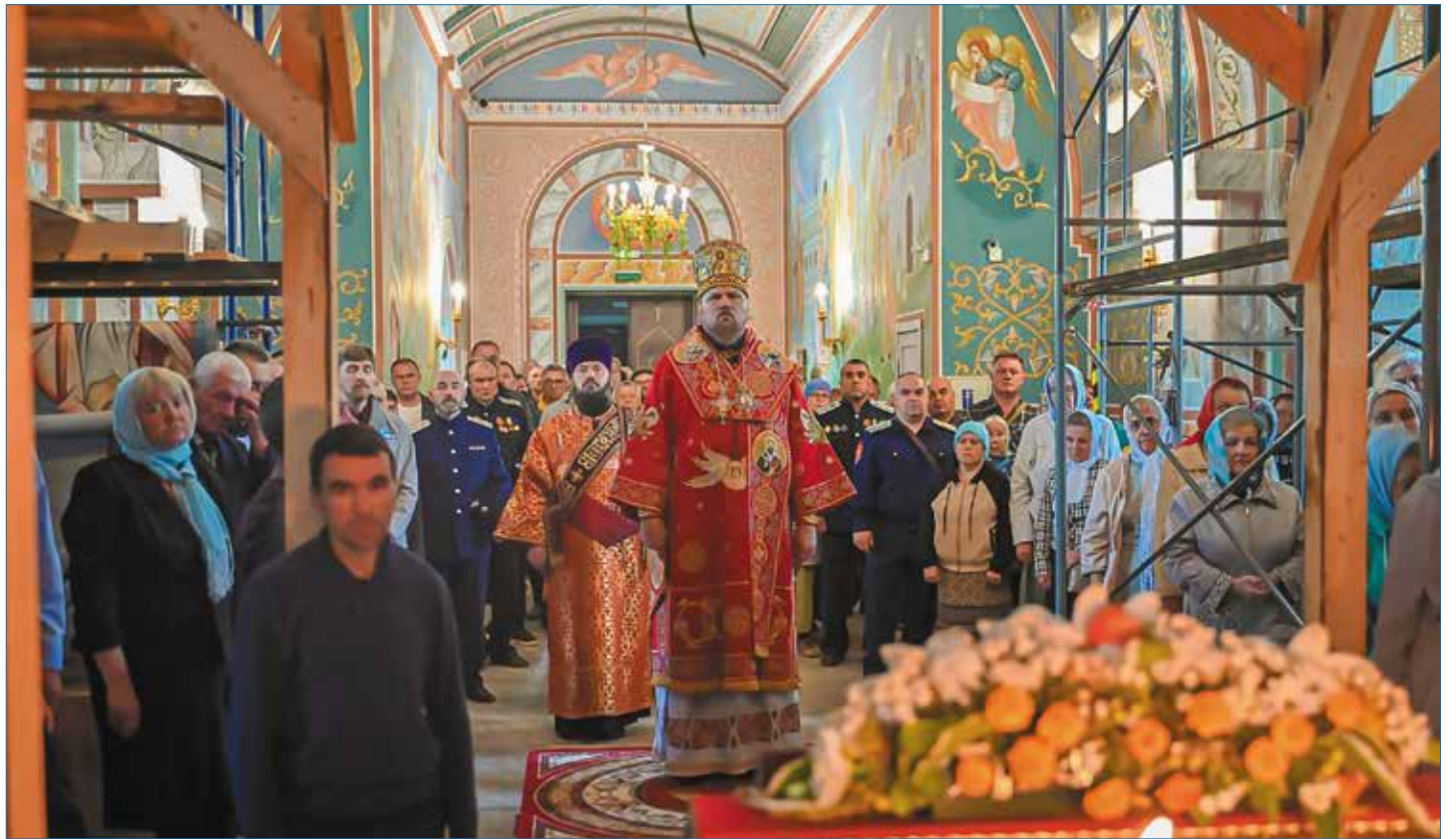
Архиерейская служба в храме Новомучеников г. Ухты