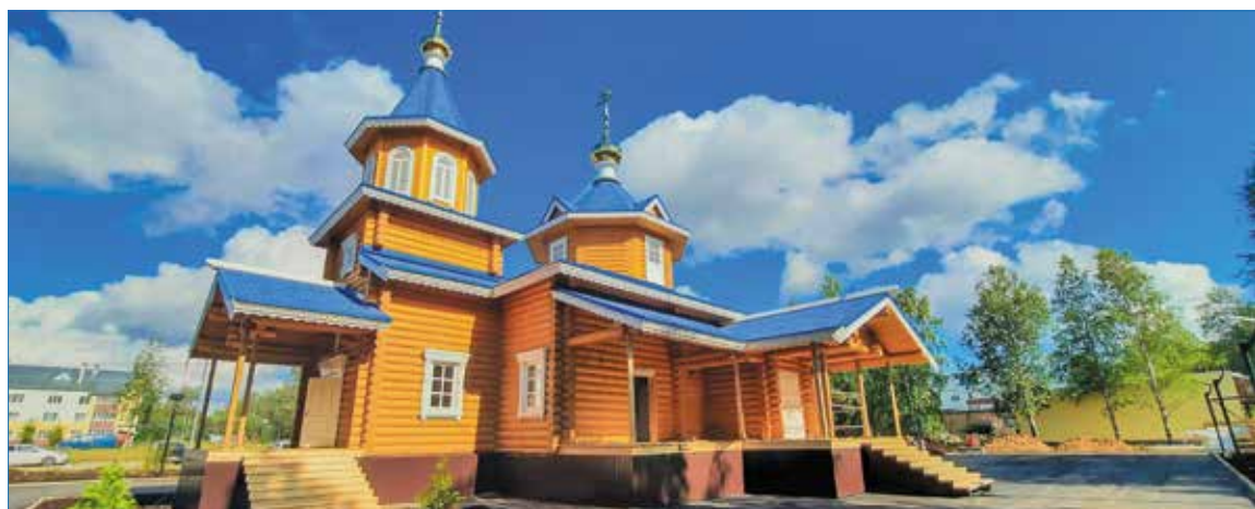
Храм Казанской иконы Божией Матери на Яреге

Проверить их «бархатистое» звучание смогли все желающие, пришедшие на освящение. По традиции каждый смог ударить в колокол. А профессионалы-звонари даже устроили мини-концерт для православной публики.