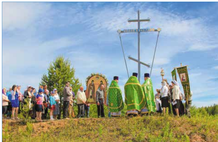
У Поклонного креста в Боровом

Обычай устанавливать поклонные кресты берет начало в глубокой древности. На Руси поклонные кресты ставили на особых памятных местах, на перекрестках дорог, неподалёку от сел и деревень, дабы, отправляясь в путь или входя в село, человек вознёс благодарственную молитву Господу и небесным заступникам. Поклонный крест — это духовный щит от всех врагов, видимых и невидимых.