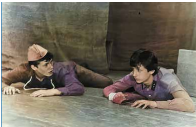
Репетиции и спектакли в театре «Ровесник», г. Ухта, февраль 1985 г.