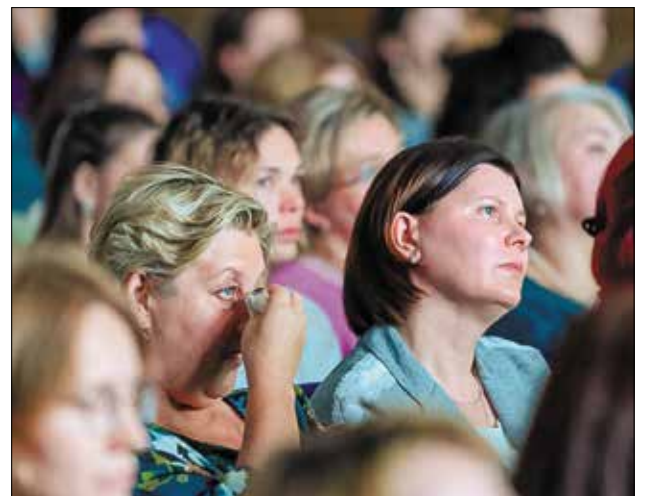
На кинопоказе в Сыктывкаре