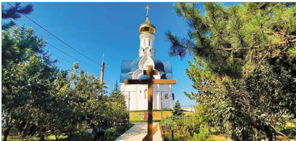
Церковь Державной иконы Божией Матери

Как до сих пор согревают эти ласковые слова, которыми встречал путников пре-