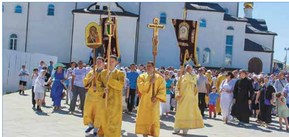
Первый крестный ход в Крещенском парке г. Анапы