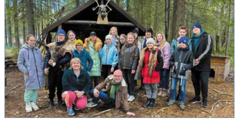
Авторы проекта с учениками в этнопарке в селе Ыбе

В Сыктывкаре впервые прошёл II межрегиональный этап XIX Всероссийского конкурса в области педагогики, воспитания и работы с детьми и молодёжью до 20 лет «За нравственный подвиг учителя» по Северо-Западному федеральному округу. Среди победителей престижного состязания педагогов – проект из Ухты.