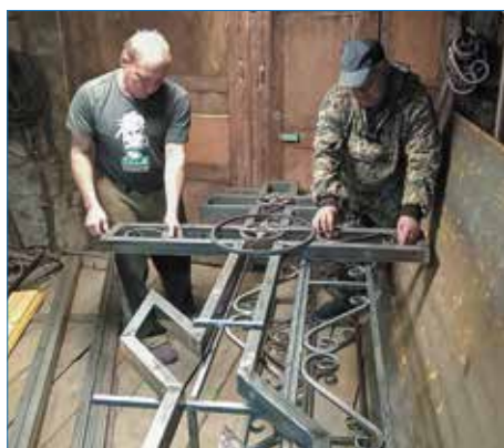
Местные умельцы в Усть-Цильме работают над созданием Поклонного креста

Теперь гости и жители Сосногорска могут попросить благословения у Бога на въезде и выезде из города.