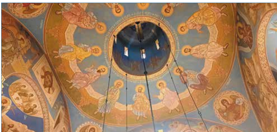
Под куполом храма прп. Серафима