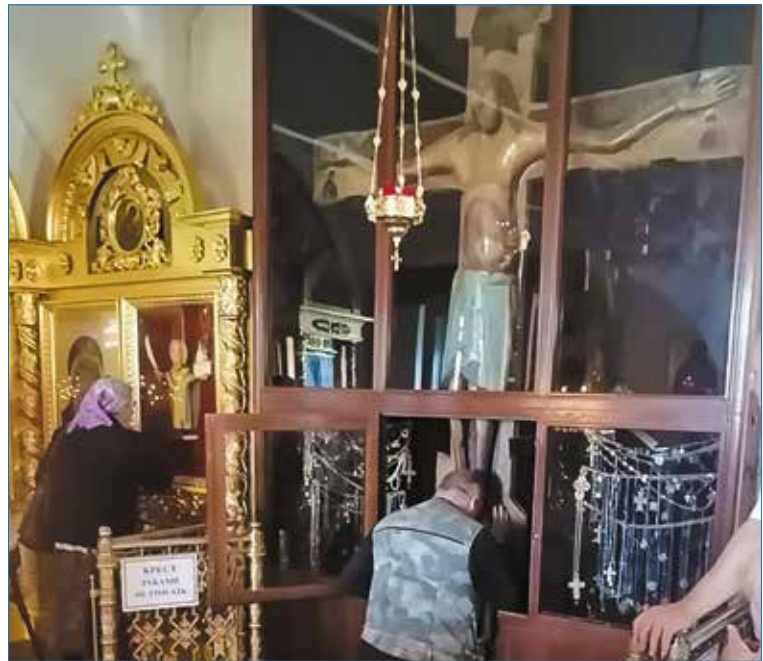
У Годеновского креста

Испытываешь настоящую гордость, когда узнаешь о таких людях, искренне любящих Родину, ближних. И особенно приятно, когда этим человеком оказывается твой земляк, юность и зрелые годы которого прошли на земле Коми. Дай Бог нашим воинам и священникам уцелеть в этой страшной мясорубке и вернуться домой.