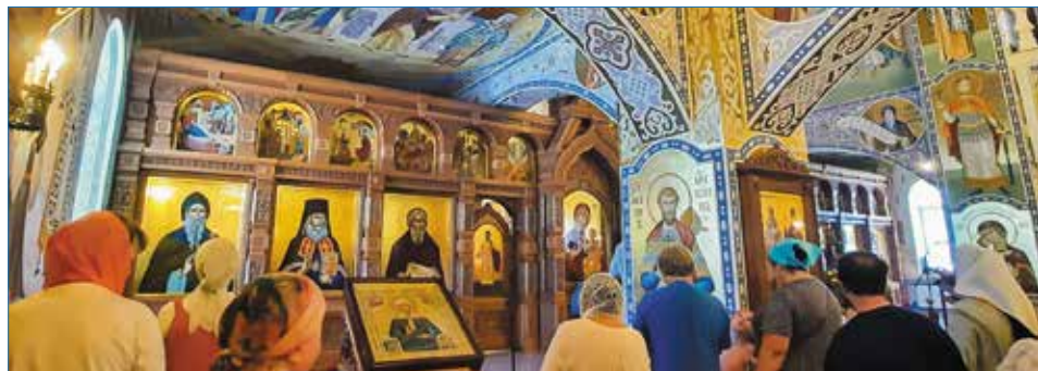
На престольном празднике в храме св. Владимира