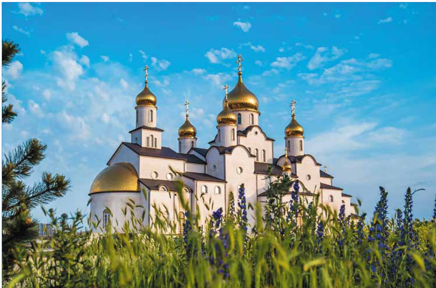
Владимирская церковь в Крещенском парке

Надо сказать, что Крещенский парк еще в стадии строительства. Многие из задумок