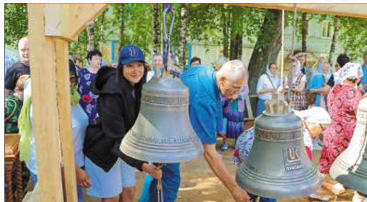
Прихожане смогли проверить «бархатистое» звучание

Всяческая единою в начале собою непосредственно создавший Господи, ныне же вся посредственно действующий гласом звона сего освященного, всякое уныние с ленивством от сердец верных Твоих отжени, страх же Твой в них с благочестием вкорени и спешных на молитву, скорых же ко всякому благому делу Твоею силою сотвори, избавляя нас от всех наветов вражних, и невредных от злорастворенных воздушных заветрених соблюдая: молитвами Богородицы и всех святых Твоих, яко един милосерд.