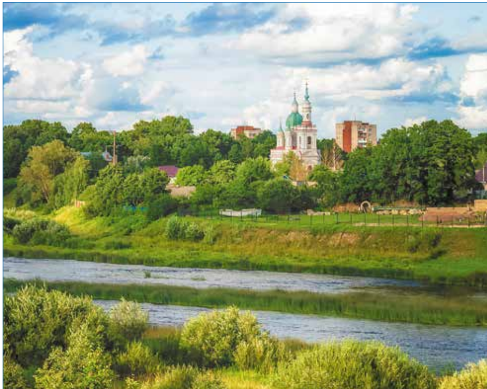
Собор великомученицы Екатерины в г. Кингисеппе.