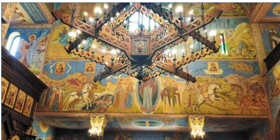
В Свято-Серафимовской церкви