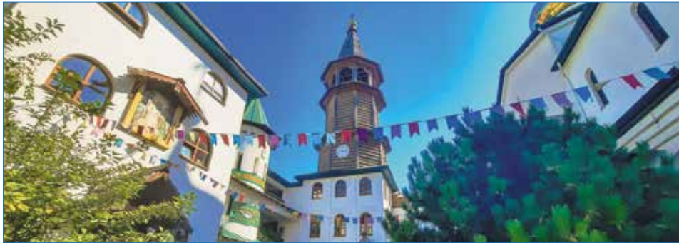
На территории храма св. Серафима Саровского

подобный Серафим Саровский. И как нам порой не хватает этой искренней теплоты в общении. Неудивительно, что в церкви к батюшке Серафиму 1 августа устремляется столько верующих во всех городах православного мира. И уже который год прихожу в день преподобного в храм св. Серафима Саровского в Анапе. И каждый раз радуюсь, как дружно, с любовью здесь отмечают престольный праздник.