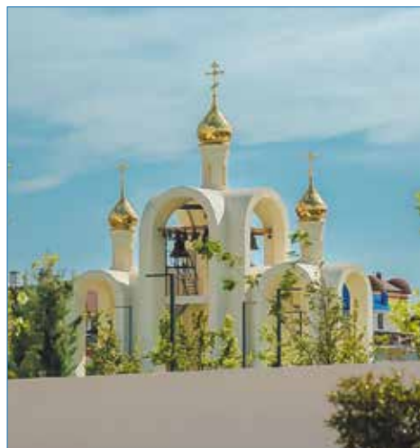
Звонница в Крещенском парке

Отрадно, что в Анапе так бережно относятся к вере предков, к храмам православным, чтут историю. И это хороший пример для других городов России.