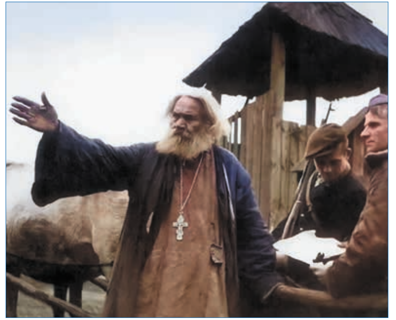
На партизанских тропах Белоруссии