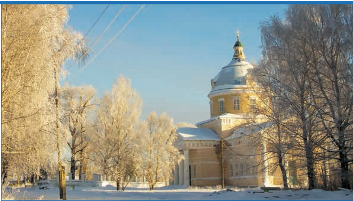
Храм свт. Николая Чудотворца