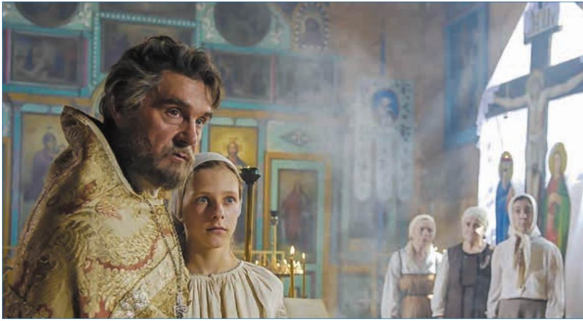
Кадр из фильма «Поп»