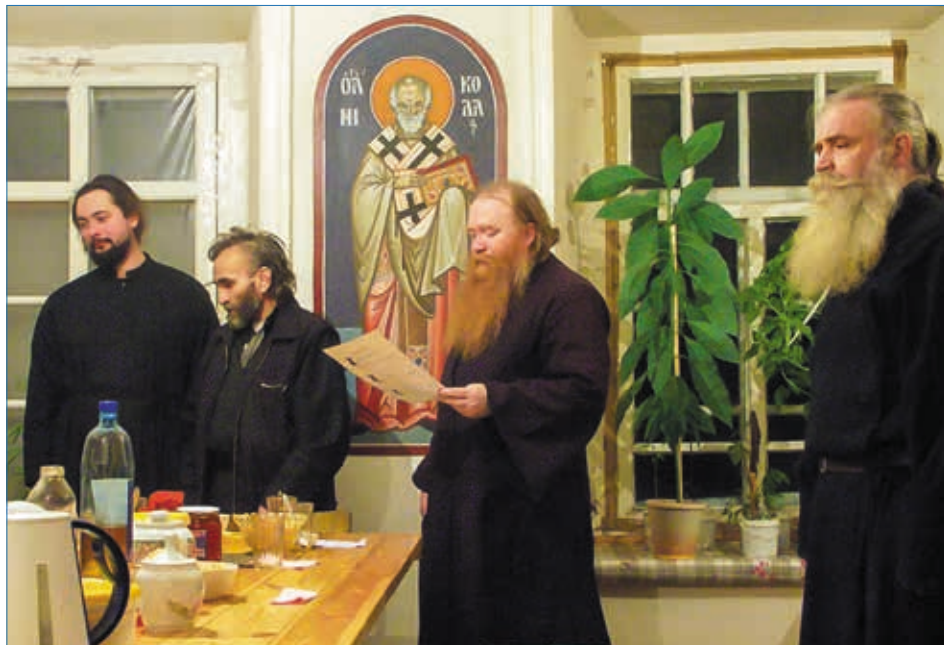
В монастырской трапезной