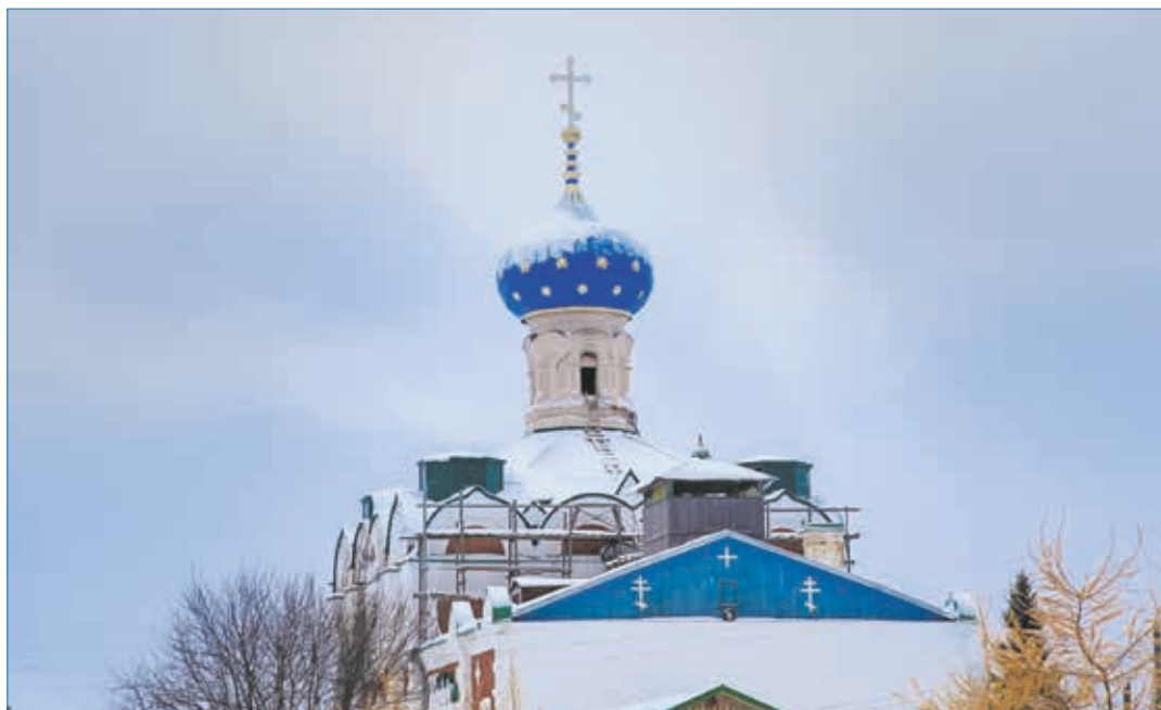
На соборе преп. Зосимы и Савватия Соловецких воздвигнут новый купол с крестом

Каменный собор в византийском стиле в честь Зосимы и Савватия, Соловецких чудотворцев построен в 1911 году. 28 метров в высоту, пять куполов, кирпичные узоры, в нем было уникальное тепловое отопление. Печь топили всего дважды в месяц, загружая по телеге дров. Тёплый воздух циркулировал по специальным каналам в стенах, внутри здания храма. Украшал собор одиннадцатиметровый резной