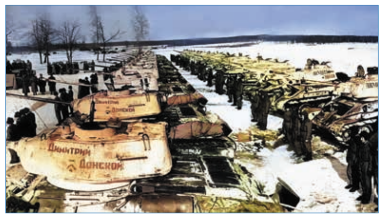
7 марта 1944 года Красной армии передана танковая колонна им. Дмитрия Донского, построенная на средства Церкви. На башнях танков видна надпись, выведенная красной краской – «Дмитрий Донской»

Особая позиция по отношению к РПЦ была у заместителей на оккупированных территориях гауляйтеров Эриха Коха, Генриха Лозе,