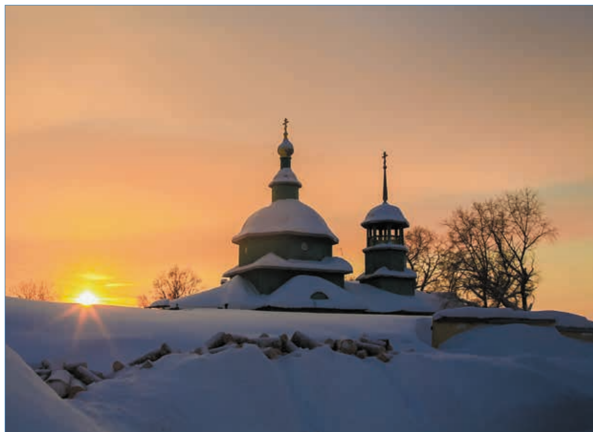
Троице-Стефано-Ульяновский монастырь.