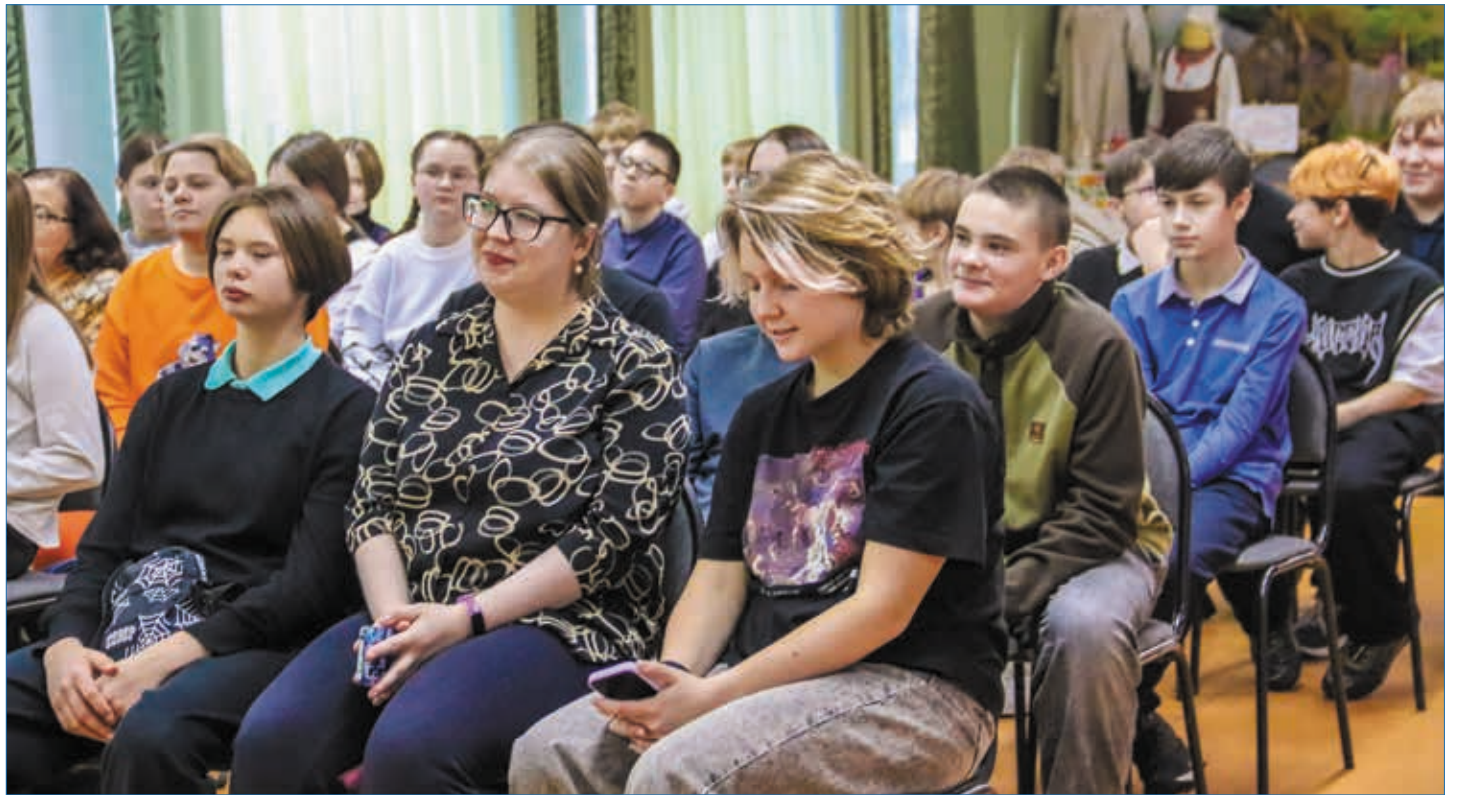
Участники акции «Молодёжь выбирает классику»

– Тема русского языка всегда всех волнует, потому что у каждого говорящего по-русски есть своё мнение на этот счёт. Молодёжь критически смотрит на язык старших, те гневно критикуют то, что говорят и пишут представители подрастающего поколения.