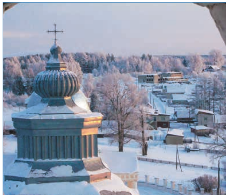
Вид на Великорецкое с колокольни

В обычной жизни, одолеваемый заботами, я нечасто задумывался над смыслом бытия. Как важно современному человеку, развращенному благами цивилизации, вот так однажды сорваться с насиженного места перед праздниками и поехать по святым местам. Пожить, поработать, пообщаться с людьми, сделавшими смысл жизни свое служение Господу. Поездка, которая длилась чуть больше недели, дала мне такой заряд православной духовности, веры, что его хватало до следующего крестного хода.